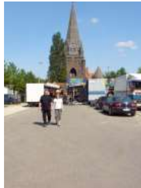
Sinksen kermis 11.05.08