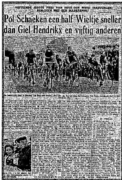
Krantenartikel uit het Belang van Limburg, 3 juli 1959.

In Heusden werd in 1928 al een kermiskoers voor liefhebbers ingereden. Heusden kende in die tijd vele jonge wielrenners en elk van hen had zijn aanhangers.