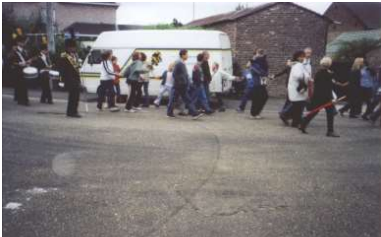
De Vlaamse Cramignon. Let op de voordanser met de bloementuil