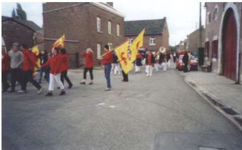
De Cramignon van de Walen