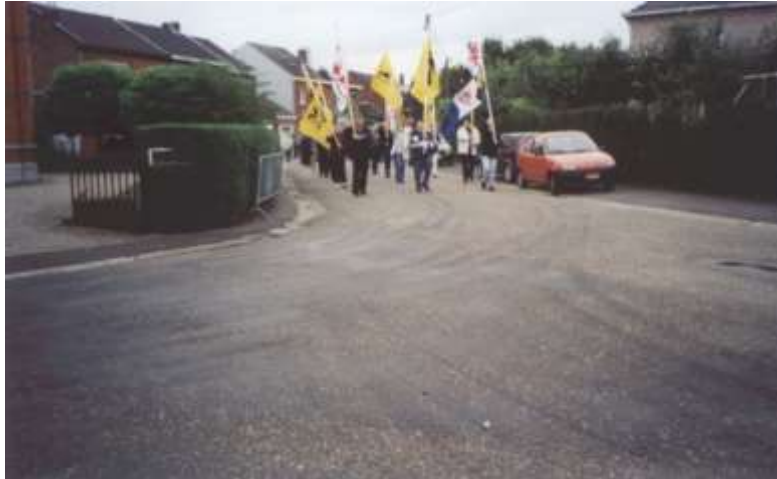
De kop van de stoet der Vlamingen