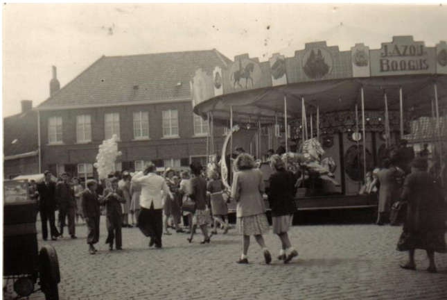
De Ommegang in Kachtem in 1944. Sinds het Interbellum zijn attracties ook visueel aantrekkelijk.