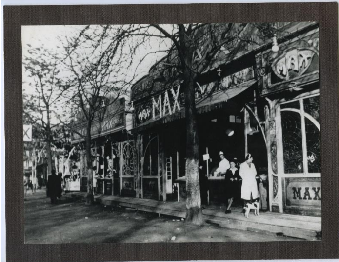
Wafelkraam Max op het Sint-Pietersplein in Gent in 1974.

vrijerskoeken van speculaas uit als ze verkering wilden aanvragen. Oliebollen verschenen pas veel later, in de 2e helft van de 19e eeuw. Voordien waren vet en suiker nog veel te duur. Wist je dat de kermis de bakermat is van onze frietjes? Het eerste frietkraam stond in 1838 op de kermis van Luik en kende al gauw een enorm succes. En hoewel suikerbakkers de techniek om suiker te 'spinnen' al sinds de 18e eeuw kenden, vond de suikerspin pas na Expo 58 geleidelijk aan zijn weg naar onze kermissen.