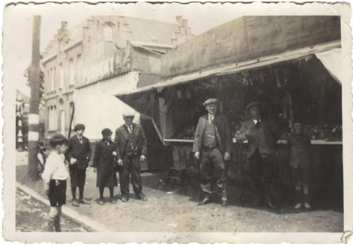
Snoepkraam op de kermis in Woesten in 1938.

plaatsmeesters oog voor hebben, is de opbrengst voor de stadskas. Ze hebben geen voeling met de magie van de kermis noch met het feit dat het een familiegebeuren is.”