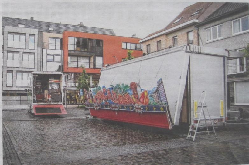
De kermis van juni werd gisteren opgebouwd in het centrum van Diepenbeek.

"Diepenbeek is natuurlijk geen alleenstaand geval", zegt Eugene Vanlingen. "Meestal zijn het kleinere wijkkermissen die doodbloeden en afgeschaft worden. Maar de gemeentebesturen moeten zich realiseren dat er ook een groep foorreizigers is die net van die kleinere kermissen leven. Bovendien komen er in de komende jaren een 25-tal nieuwe foorkramers bij, jongeren van 16, 17, 18 jaar die in de voetsporen van hun familie treden. Die moeten ook ergens kunnen werken. In mijn familie zijn er gasten die nu al, buiten de winter-