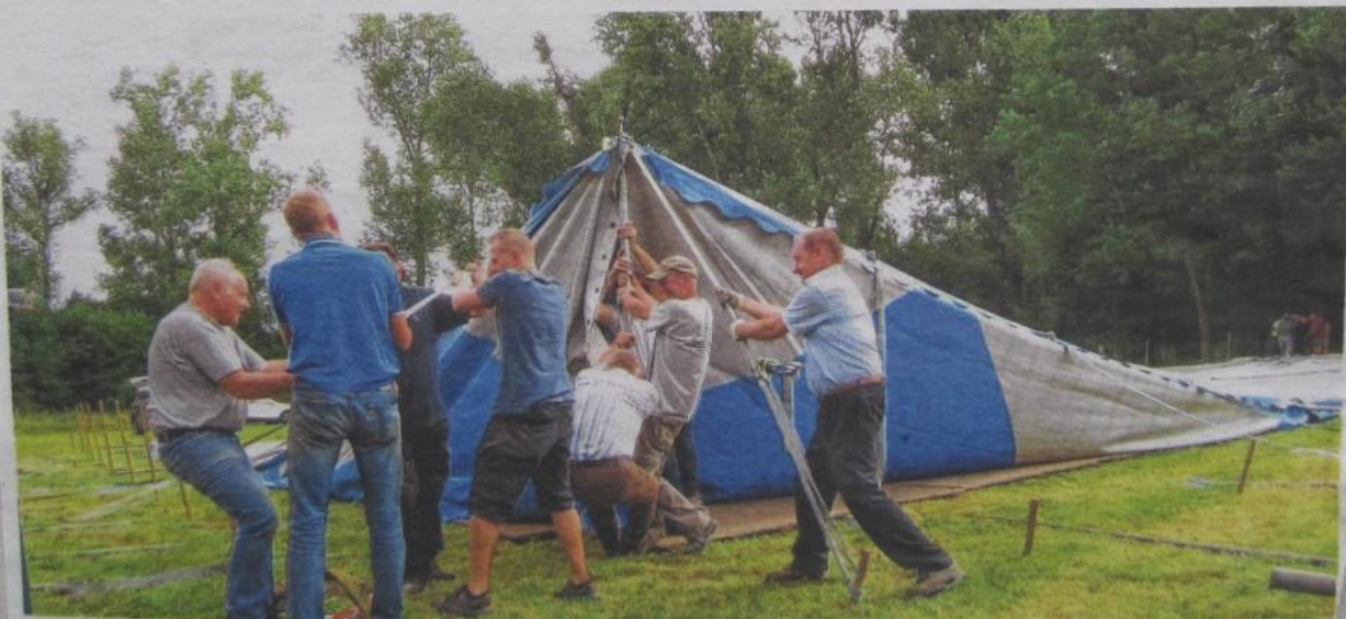
Met man en macht wordt de enorme spantent rechtgezet voor de vierdaagse kermis.

→ Spurk Kermis op 4, 5, 6 en 7 augustus → www.spurkkermis.be