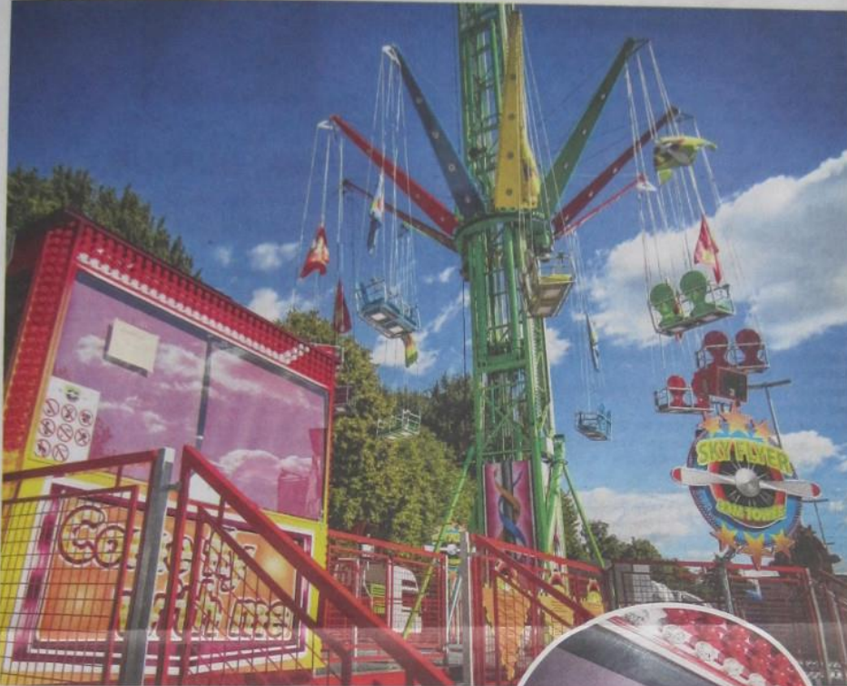
De Sky Flyer wacht op een specialist voor herstelling. Er wordt ook gezocht naar een werkmans voor de opbouw (inzet).

Door een computerstoring heeft de nagelnieuwe attractie Sky Flyer nog geen minuut gedraaid op Hasselt-kermis. Pas na de opbouw werd het euvel ontdekt. Een storing op één van de printplaten hield de 33 meter hoog rondtollende tweezitters aan de grond.