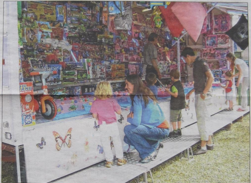
De stad Bilzen geeft financiële steun aan verenigingen die een activiteit organiseren tijdens de dorpskermissen. Het stadsbestuur hoopt zo meer foorkramers te lokken.