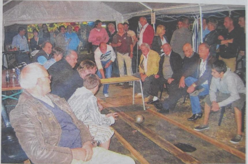
Kermis in Spurk is al sinds 1896 een traditie, die nog altijd veel volk lokt.