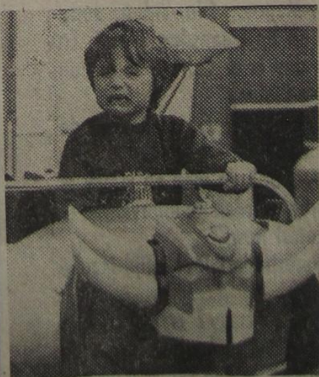
Niet altijd leuk

Een kerk werd altijd in de lente of de zomer gewijd. Want de bisschoppen meden de herfst en de winter. Ze reden immers met de koets en de wegen van toen kun je natuurlijk moeilijk met deze van nu vergelijken. — S.D.