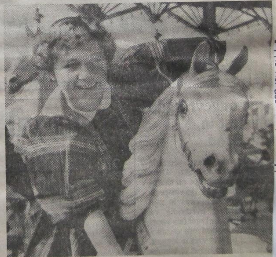
De paardenmolen een plezier voor klein en groot

Dergelijke volksspelen waren massalokkers. Het hard labeur werd eventjes vergeten. Het was hun manier om de batterij weer op te laden.