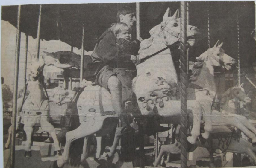
Vaste waarde in het kermisgebeuren : de paardencarrousel. Nostalgie. De kleintjes worden erop getild maar het zijn hun ouders die vertederd raken. Glimmend koper, blinkende paardjes. Zolang die draaien zal er kermis zijn. De deuntjes blijven vertrouwd klinken. Klanken die niet versleten raken...